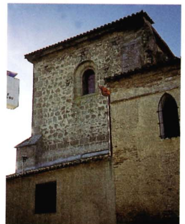
Calera y Chozas