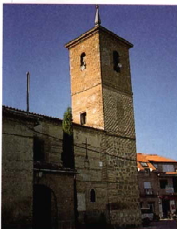
Calera y Chozas

La vuelta al pueblo de Alberche se realiza por el mismo camino