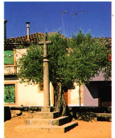
Herrerueta de Oropesa