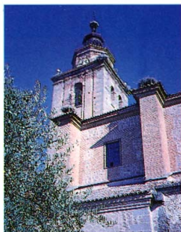
La Calzada de Oropesa