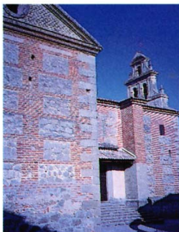
La Calzada de Oropesa