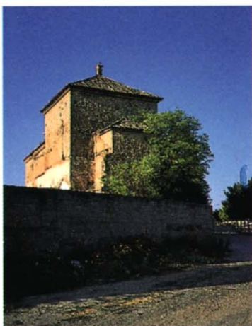
El Puente del Arzobispo

Pueblo de origen antiguo, debió de ser un poblado vettón, pues en él se halló un verraco que, hoy, se encuentra en una residencia de campo llamada Valdepalacio. En un paraje cercano, llamado La Matanza, se produjo una importante batalla en época romana. En el periodo musulmán, se alzó una robusta torre que dio nombre